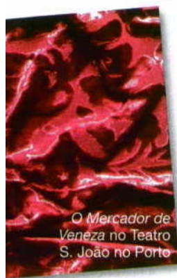
O Mercador de Veneza no Teatro S. João no Porto

Não que seja obrigatório, mas apetece-nos começar pelo regresso ao Teatro Nacional de São Carlos (TNSC) e o Quebra Nozes , talvez o mais dançado de todos os grandes bailados clássicos, pela mão da Companhia Nacional de Bailado (CNB) e do coro e orquestra do TNSC (22 de Nov a 13 de Dez). No Teatro Camões há um ciclo de dança contemporânea com com-