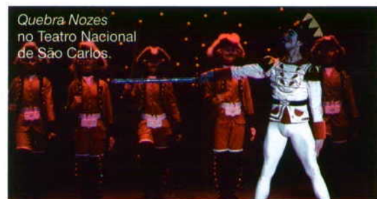
Quebra Nozes no Teatro Nacional de São Carlos.

por Maria Muñoz e Pep Ramis apresenta He Visto Caballo (12 e 13), no âmbito do Temps d'Images , festival que cruza as artes cénicas e da imagem, em vários palcos da cidade (30 Out a 18 Nov). Na peça Que Depois do Dia Vem a Noite , de Tim Etchells, dezasseis crianças dos 8 aos 14 anos explicam como o seu mundo é determinado pelo dos adultos (27 a 29). Não que seja obrigatório, mas apetece-nos terminar com uma peça para a miudagem. Bob o Construtor regressa ao Pavilhão Atlântico (10 a 13). Traz os seus amigos e as suas máquinas, em tamanho real, com o objectivo de transformar um monte de lixo num palco.